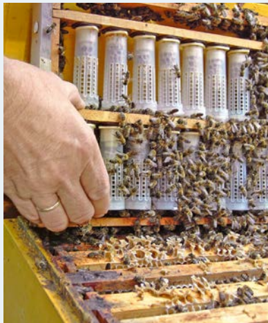
Zuchtrahmen mit gekäfigten Weiselzellen.