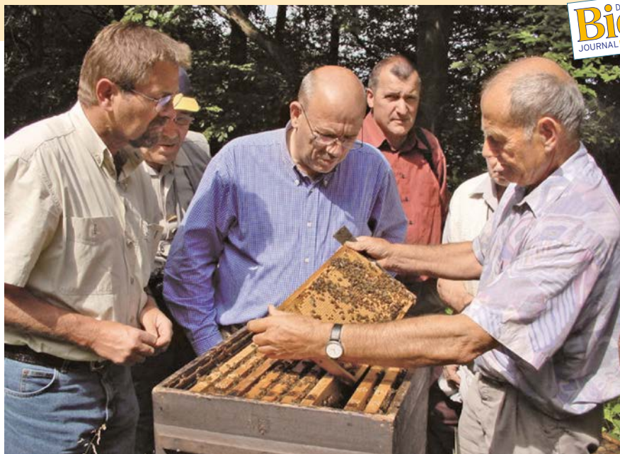
Ein Zuchtvolk wird begutachtet.

Lieber einige Tage länger stehen lassen! Bei solchen Völkchen, die nach Tagen noch nicht bauen, stimmt etwas nicht, entweder mit der Königin, dem Futterteig, der Zusammensetzung des Völkchens, dem Aufstellungsraum, dem Zugang zum Futter oder der Temperatur im Aufstellungsraum. Königinnen solcher Völker sind, wenn überhaupt vorhanden, Todesanwärter. Vor dem Versand sollten alle Kästchen auf das Vorhanden-