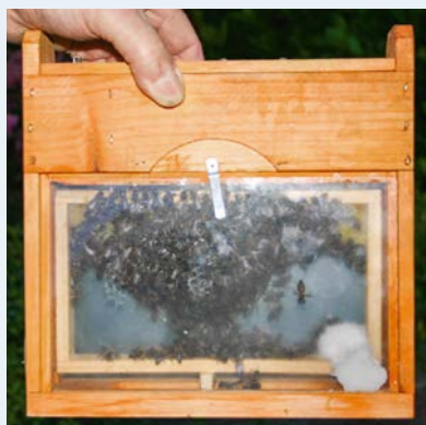
Oben: So soll es aussehen: Das Völkchen baut.