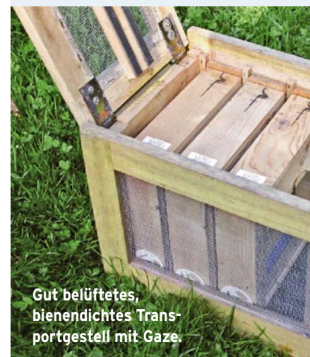
Gut belüftetes, bienendichtes Trans- portgestell mit Gaze.

Sämtliche Transportgestelle und Begattungskästchen müssen gut lesbar und unverwischbar (Filzstift) die Namen der Anlieferer tragen.