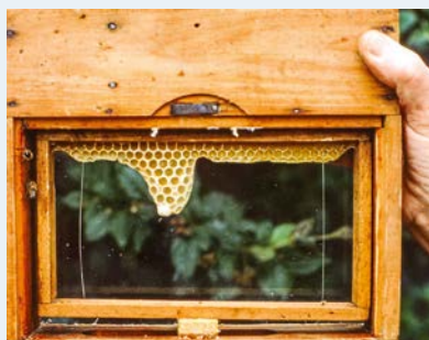
Unten: Hier stimmt etwas nicht. Die Bienen haben nicht gebut und sind ausgezogen.