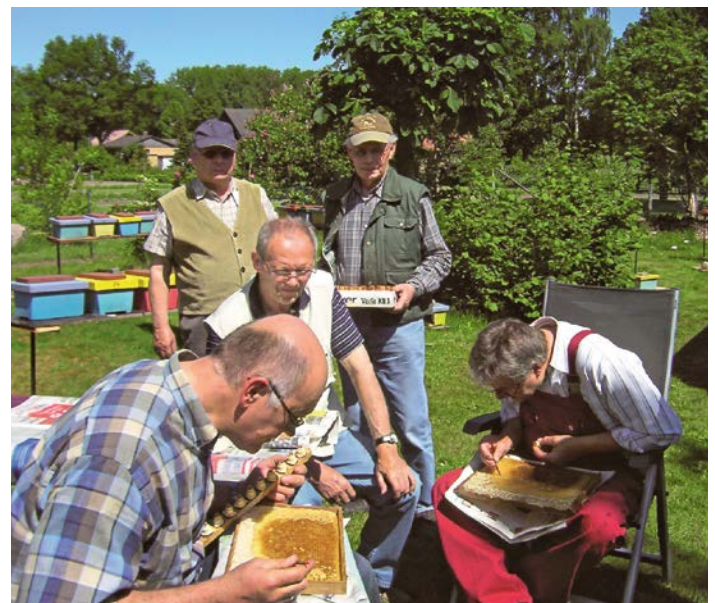
Umlarvveranstaltung auf dem Stand eines Züchters.