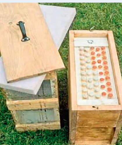
Anbrütkekasten im Standmaß.

chen verändert, und die Annahme ist besser. Für den Transport über eine längere Strecke empfehle ich die Verwendung eines Anbrüters. Der Anbrüter ist bei mir ein kleiner Kasten (Ablegerkasten), der drei oder vier Waben im Standmaß fasst. Er hat einen Aufsatz für die Zuchtnäpfcchen. Dieser Abstand von den Zuchtnäpfcchen zu den Oberträgern der Waben sollte 2,5–3,0 cm betragen. Diese Angaben mache ich hier, da viele Imker den Anbrüter selbst bauen wollen. Im Imkereifachhandel gibt es aber auch fertige Exemplare. Der Anbrüter wird mit einer Wasser-, einer Futter- und einer Pollenwabe gefüllt. Eine Wasserwabe ist eine leere Wabe, die unter einen Wasserstrahl gehalten wird; anschließend streicht man mit der flachen Hand über die Oberfläche. Dadurch dringt das Wasser in die Zellen der Wabe ein. Die Honig- und die Pollenwabe sollten möglichst frisch sein. Es dürfen weder Brut noch Eier auf den Waben sein. Die Bienen, die in den Anbrüter kommen, sind entscheidend für die Annahme der Larven. Als Faustformel gilt: Mindestens doppelt so viele offene Brutwaben, wie der Anbrüter Waben fasst, werden in den Anbrüter abgekehrt. In einen Anbrüter, der drei Waben fasst, kehre ich also mindestens die Bienen von sechs offenen Brutwaben. Ganz wichtig: Es darf auf keinen Fall eine Königin in den Anbrüter gelangen! Wenn der Anbrüter gefüllt ist – er hat kein Flugloch beziehungsweise das Flugloch ist geschlossen –, wird er möglichst dunkel und kühl